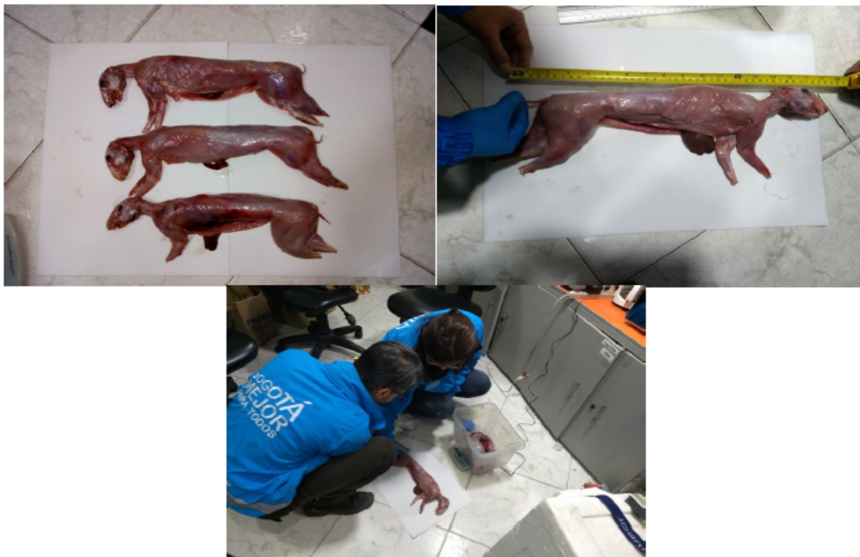
Figura 2, 3 y 4. Verificación de 2593 g de Dasyprocta sp. Acta Única de Incautación No. 160371

Al realizar la verificación detallada de las características fenotípicas de los individuos incautados, se logró determinar que se trataba de 2.593 g de carne de Dasyprocta sp. (Figura 2, 3 y 4).